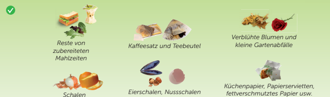
Reste von zubereiteten Mahlzeiten